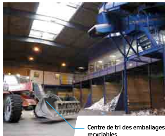
Centre de tri des emballages recyclables