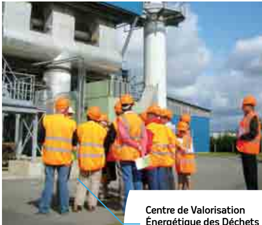
Centre de Valorisation Énergétique des Déchets

c'est le coût de gestion des déchets déposés en déchetterie, à la charge de l'habitant.